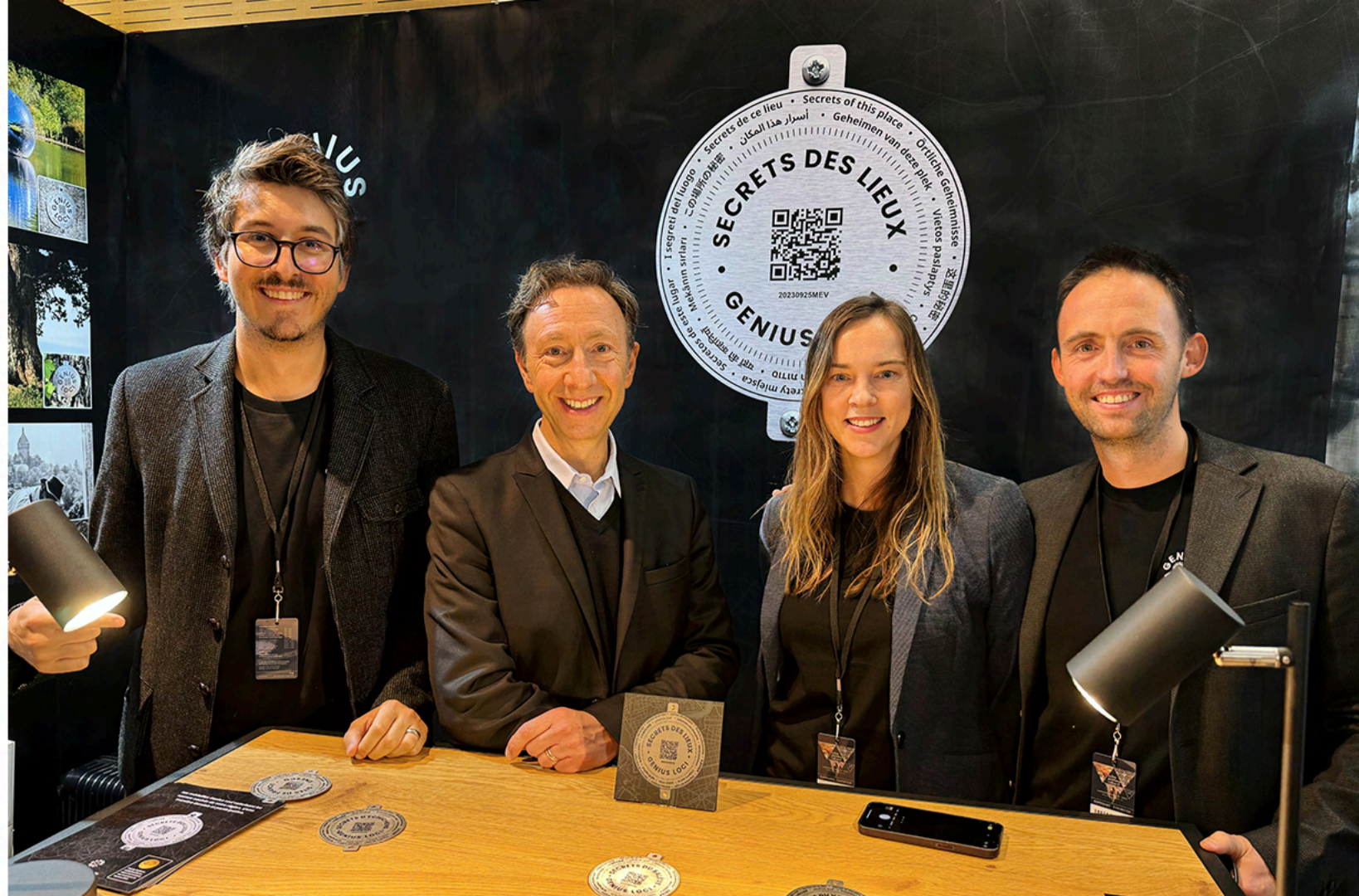
Magazine "Mission Patrimoine" numéro 11 Janvier - Mars 2024